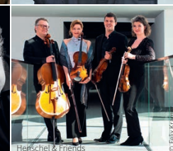
Henschel & Friends